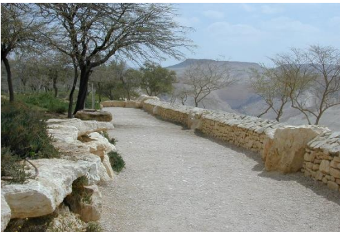
גן לאומי בית שערים, יהלום וצור אדריכלי נוף