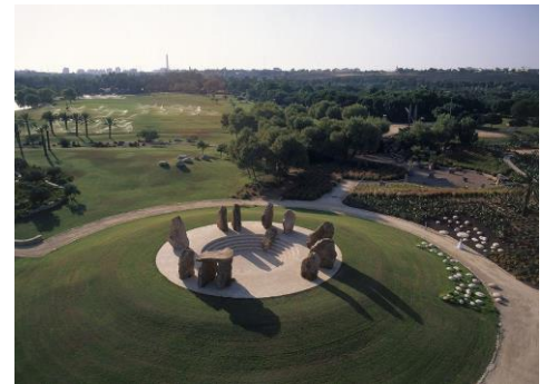
פארק הירקון, גדעון שריג, אדריכלות נוף