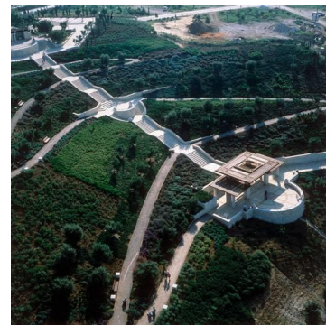
טיילת ארמון הנציב, שלמה אהרונסון אד. נוף