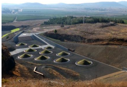
מחצבת אביטל, צורנמל טורנר, אדריכלות נוף