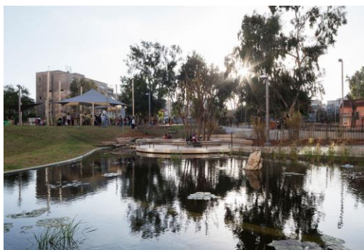
גן קרית ספר, רם איזנברג