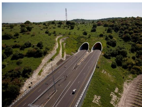
כביש 6, גרינשטיין הרגיל, אדריכלות נוף

טביעת האצבע של אדריכלי הנוף קיימת כמעט בכל מקום שבו אתם דורכים. כיום, כל רשות מקומית או ציבורית לא יכולה להרשות לעצמה לתכנן פרויקט בלי לקחת בחשבון את המרחב הציבורי. אדריכלי הנוף הם אלה המשלבים קיימות, איכות חיים וסביבה עירונית.