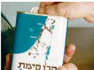
קרון קיימת. ייעור יתר

לנגד עיניהם של הברטים עמד האינטרס הכלכלי של הכתר - הנמל הגדול ביותר במזרח התיכון. אחרי שהבריטים עזבו, כל מנהיגי העיר המשיכו את הקו הזה