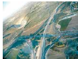
מחלפים. יש התקדמות

"לפני 30 שנה נבחרה בהולנד שרת תחבורה שהצהירה שלא יסללו עוד כבישים. פה עוד לא מוותרים על מחלפים, אבל מקימים מחלף פחות מהיר כדי לבזבז פחות שטח"